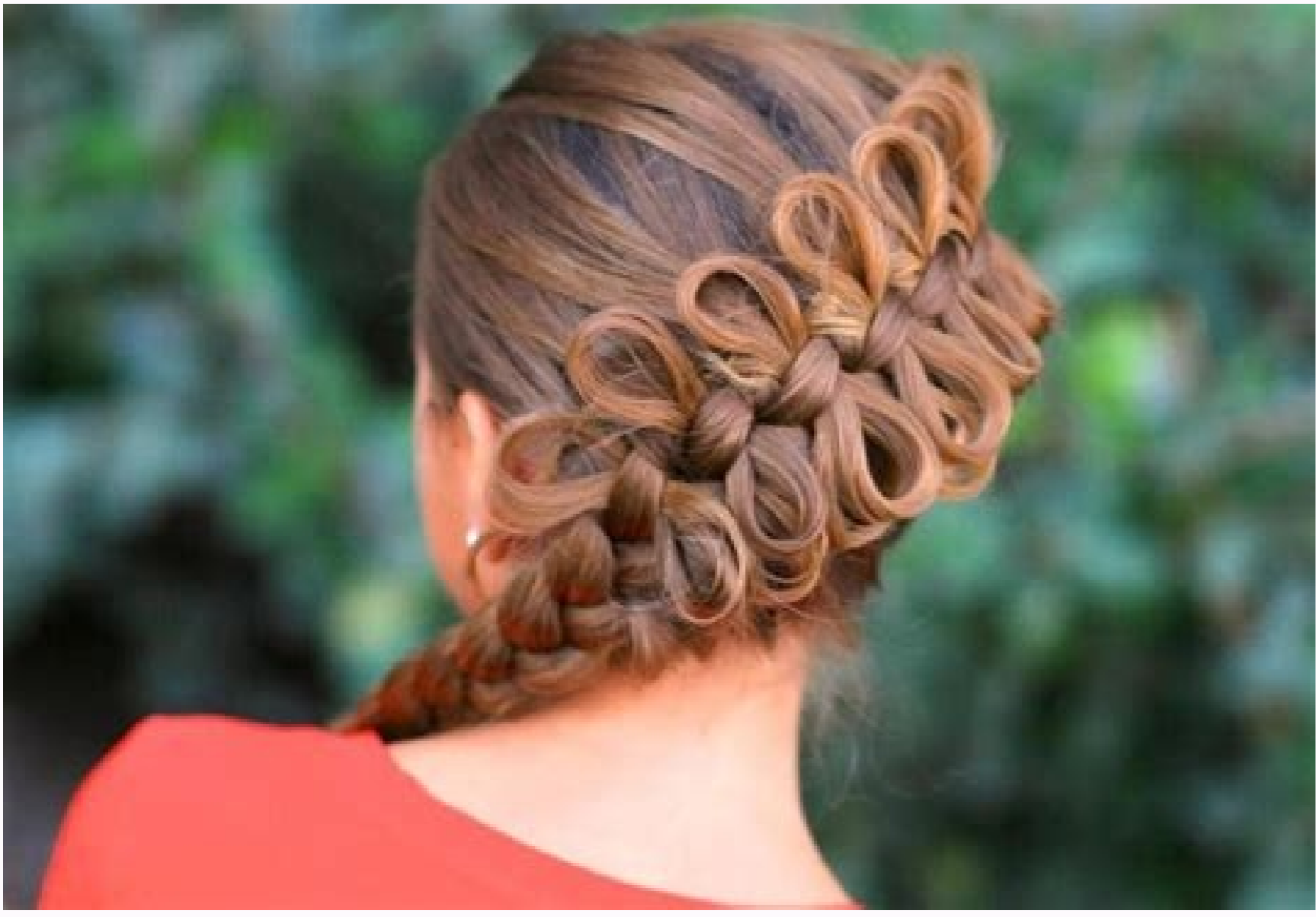
Did celts have curly hair. Ancient celtic hairstyles female. Did celts wear braids. Ancient celtic hairstyles male. How did the celts wear their hair. Braids in celtic culture. Ancient celtic mens hairstyles.